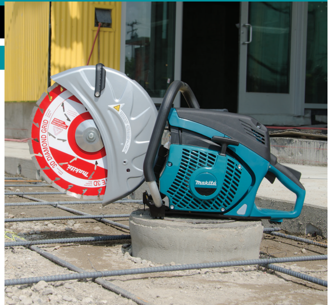
(Se muestra con hoja de diamante - opcional)

El color azul-verde de Makita es la imagen visual registrada de Makita Corporation y está protegido bajo la ley común y registrado en la Oficina de Marcas y Patentes de los Estados Unidos. NTF-0614 MA-3587-14B